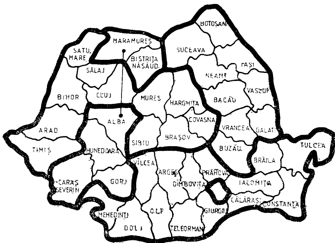
Fig. 3. Macro-arii culturale în România (analiza cluster cu legături medii)

Datorită unor profiluri foarte specifice, ele se încadrează cu greu într-o grupare sau alta. Din acest motiv, orice variație în metodologia de clasificare le schimbă foarte ușor poziția. În aceeași categorie, în afară de Suceava și Buzău se încadrează și Gorj, Dolj, Satu Mare și Constanța. Toate aceste 6 județe sînt situate la baza arborilor din fig. 2 (sub nivelul