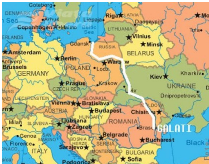
Figura 3: Culoarul de comunicație Vistula-San-Prut, un proiect al României vechi de peste 100 de ani, se află chiar pe axa Marea Neagră-Baltica (Amălinei, 2017)

Astfel, un alt etaj al componentei românești al Trimarium ar trebui să aibă în vedere cealaltă platformă demografică românească majoră: R. Moldova, care poate fi susținută pentru integrare în Inițiativă (Trimarium) de România, ca mijloc de unificare a celor două spații. Prutul trebuie transformat din frontieră în cale de comunicație, pus în lucru ca parte a intereselor românești în cadrul direcției de comunicație Nord-Sud până la Baltica. Istoric, de altfel, Prutul și Nistrul au fost culoare majore de conectare ale Mării Negre la Baltica, circulația mărfurilor fiind atât de intensă, încât, ne arăta Brătianu în „Marea Neagră”, acesta poate fi asociat cu cristalizarea statelor feudale românești. După cum am văzut, la începutul secolului XX, românii se gândeau să resuscite acest coridor prin interconectarea Vistula-San-Nistru/Prut. Dar Prutul nu va deveni axă de comunicație dacă nu va fi asociat coridorului Rin-Dunăre și nu va fi traversat cât mai rapid de Autostrada Moldova, spre Chișinău: