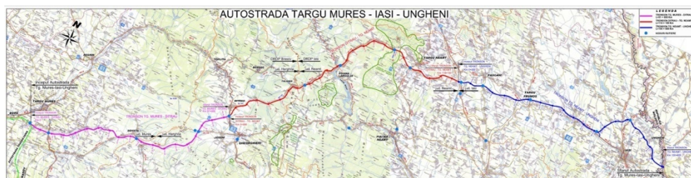
Figura 4: Autostrada 8: Târgu Mureș-Iași-Ungheni (Peundemerg.ro, 2011)

„Pentru cei 310 km ai autostrăzii noastre (Ungheni – Iași – Tg. Mureș) s-a realizat în 2007 un studiu de fezabilitate. Un studiu de fezabilitate a fost realizat în 2009. După încă trei ani, Comisia Europeană a inclus autostrada în rețeaua continentală care ar trebui realizată până în 2020. Iar prin 2014 s-a dărâmat totul. Întâi s-a anunțat o licitație pentru refacerea studiului de fezabilitate inițial, pe motiv că estimarea costului, de 9 miliarde de euro, era totuși exagerată. Pe urmă s-au făcut tot felul de liste de priorități, pe care autostrada a fost inclusă ba pe locul 4, ba pe locul 9, ba la categoria «rezerve». Masterplanul de transport al României stabilea în 2015 că se va lucra la această autostradă abia din 2021. N-ar fi rău nici așa, numai să fie. Ca să nu ne lungim, după ce s-au tot anunțat licitații pentru refacerea studiului de fezabilitate, licitații care nu s-au mai organizat, CNAIR a anunțat că la o adică ar fi bun și vechiul studiu și că