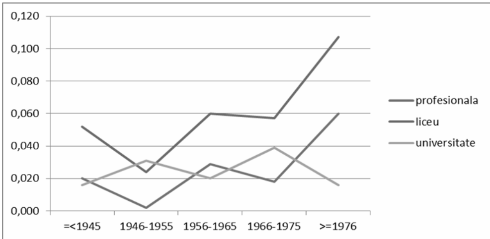
Figura 3: Evoluția efectului statusului socio-economic al tatălui (măsurat prin scorul ISEI) asupra probabilităților de realizare a celor trei tranziții educaționale