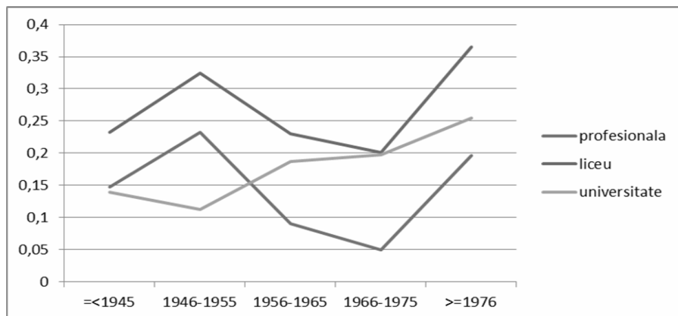
Figura 4: Evoluția efectului nivelului de instrucție al tatălui asupra probabilității de realizare a celor trei tranziții educaționale

Graficele și tablele corespunzătoare arată că teza efectelor descrescând se confirmă doar pentru comparațiile dintre accesul la ciclul liceal (care desemnează aici, în mod generic, ruta pregătitoare pentru universitate) și accesul la studiile superioare. În acest caz, pentru toate cohortele și pentru ambele efecte de reproducere investigate, parametrii tranziției la liceu sunt mai mari decât cei ai tranziției la studii superioare. În schimb, nivelul inegalității sociale este relativ asemănător între școala profesională și studiile superioare. Putem concluziona că inegalitatea socială a fost și este mai puternică în cazul promovării studiilor liceale de 12 clase decât în cazul absolvirii studiilor superioare sau al promovării școlii profesionale.