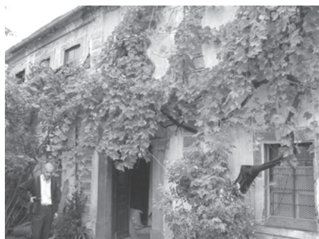
Figura 11. Corcea – Consutul Regal al României în Albania

Transilvania. Familiile Șaguna, Șina, Ucuta, Darvari, Caracaș, Mocioni, Gojdu etc. au adus contribuții majore atât pentru cultura și civilizația popoarelor în mijlocul unde s-au stabilit, cât și ideii naționale române.