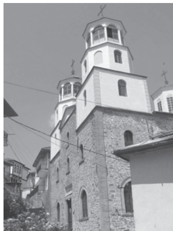
Figura 5. Biserică aromână din Crușeva – Macedonia (sec. al XIX-lea-XX). Conține donații de la meșteri din Maramureș, în perioada interbelică