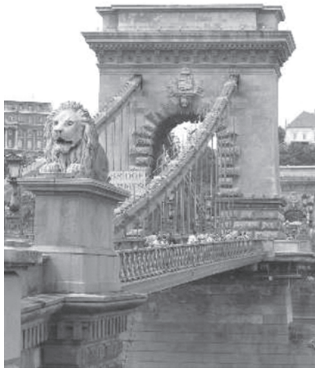
Figura 14. Podul cu Lanțuri din Budapesta. O contribuție majoră la finanțarea lui a avut-o familia aromână Șina

în scurtă vreme de stabilirea ei în Viena, a ajuns celebră în lumea financiară europeană, prin varietatea întreprinderilor și crearea unei mari instituții financiare. Ea este, poate, singura care, de la începuturi până în zilele noastre, a lăsat cea mai adâncă impresie în amintirea Românilor din Macedonia.”