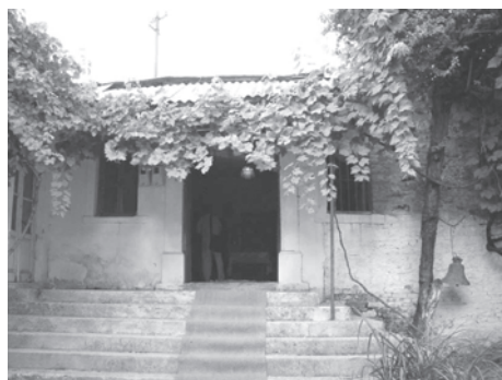
Figura 9. Corcea – intrarea în vechea Biserică (2003)

Moscopole , unul dintre cele mai mari centre economice și culturale din Imperiul Otoman, până la dispariția sa violentă la sfârșitul secolului al XVIII-lea. În momentul lichidării sale de către interesele unei facțiuni turce din Ianina, la 1788, Moscopole avea circa 70 000 de locuitori, în marea lor majoritate aromâni, o Academie, tipografie, 40 de biserici din care multe în configurații monumentale și domina comerțul dintre Occident (prin Italia și Viena) cu spațiul grecesc și Turcia.