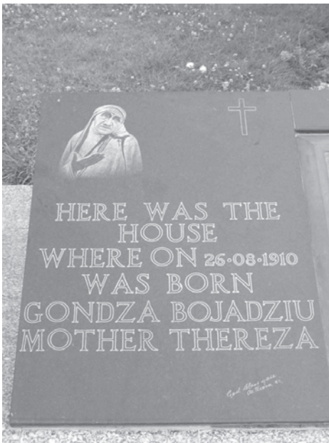
Figura 1. Placa comemorativă pentru Maica Tereza (născută Gondgea Boiagiu) în centrul orașului Skopje – Macedonia

Deși Maica Tereza are origini aromânești (Gondgea Boiagiu), aromânii nu au biserică, iar liturghia se ține în limba greacă sau macedoneană. Ultima biserică aromânească a fost distrusă de marele cutremur din 1963 (biserica nu a fost refăcută deși România a avut o contribuție importantă la reconstrucția orașului Skopje).