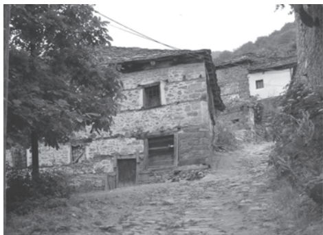
Figura 3. Maloviște (2004)

În aceeași regiune din Macedonia se află o constelație de sate, acum parțial părăsite, care conservă o arhitectură cu totul deosebită. Cel mai important dintre ele se numește Maloviște care, în secolele al XVIII-lea-al XIX-lea, avea o infrastructură cvasi-urbană, casele fiind construite din piatră și fier forjat, drumurile pavate, apă curentă și canalizare, beneficiind de o biserică monumentală. Maloviște a decăzut puternic odată cu primul război mondial, când linia frontului a trecut prin apropierea satului iar după conflagrație, Iugoslavia a refuzat să mai acorde drepturi importante aromânilor.