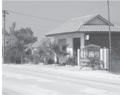
Figura 7. Școala primară românească din Deviaca (Albania, 2003)

Deși în perioada interbelică, după Grecia, Albania a avut cea mai extinsă rețea școlară și bisericească susținută de statul român, în prezent statul român nu a reușit decât subvenționarea a două școli, nici una în Tirana, la Corcea (într-o anexă a Bisericii vechi) și la Deviaca (în sud). La Deviaca, cu sprijin din România, comunitatea locală a reușit să deschidă unica grădiniță din regiune cu predare în dialect.