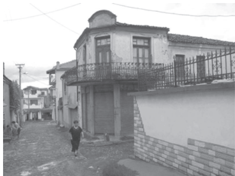
Figura 8. Corcea – casă veche negustorească peste drum de vechea Biserică (2004)