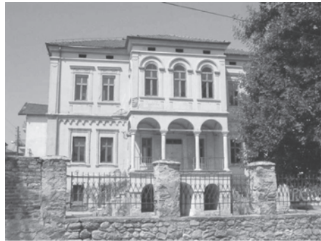
Figura 2. Liceul românesc din Bitola – Macedonia (nefuncțional) în anul 2003

mamă”). Comunitatea aromânească din Bitola, pe lângă biserici, era suficient de activă și de numeroasă să se bucure de existența unui liceu românesc, susținut de către statul român, inclusiv cu profesori. Situația juridică actuală a liceului este încă neclară, întrucât autoritățile declară că documentele care atestă proprietatea statului român asupra clădirii au fost pierdute de către autoritățile de la Belgrad în perioada comunistă. Clădirea liceului este în prezent părăsită.