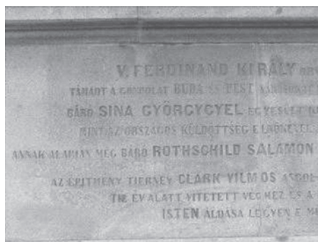
Figura 15. Podul cu lanțuri din Budapesta