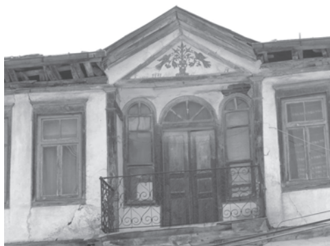
Figura 4. Locuință de negustor aromân – Crușeva, Macedonia, 2004

două comunități aromână și macedoneană. Deși punem această „discreție” pe seama situației delicate din Macedonia, al cărei guvern încearcă să prezinte cât mai uniformă compoziția etnică a părții „creștine” a țării, nu putem să nu remarcăm trecerea sistematică sub tăcere a contribuției aromânilor la istoria acestei țări. Imaginile din Crușeva sunt reprezentative, pentru a ne da seama de amploarea vieții economice, spirituale a regiunii. Crușeva a fost un centru comercial și industrial al Macedoniei. Casele mai păstrează încă amprenta breslelor prin motive votive deosebite.