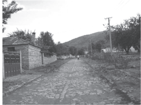
Figura 13. Moscopole mai are astăzi doar câteva case. Pavaaj de secol XVIII

de aromâni originari din Moscopole, stabiliți în Oradea. După terminarea magna cum laudae a liceului în orașul natal, Gojdu a urmat studii universitare juridice la Budapesta, Bratislava și Viena. În 1824 și-a început cariera de avocat la Budapesta, ca stagiar în biroul unui avocat sârb. S-a afirmat în mediile juridice din Budapesta, înființându-și propriul birou de avocatură și devenind celebru pentru pledoariile sale.