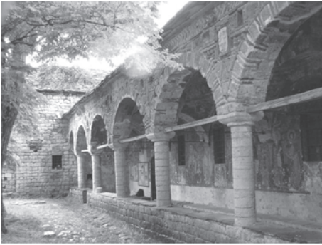
Figura 12. Moscopole. Una din cele două biserici care mai există în prezent (Sf. Nicolae, 2004)