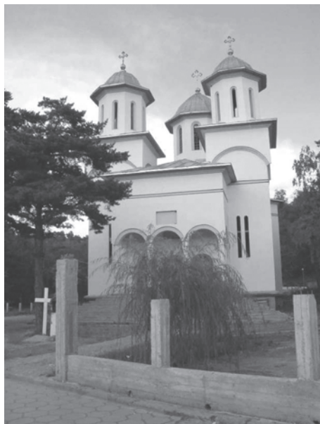
Figura 10. Corcea – Biserica nouă, în construcție (2003)

Din Moscopole și din zona adiacentă au emigrat marile familii aromâne care au contribuit decisiv la cristalizarea activităților comerciale și bancare din Belgrad și Budapesta și, în ultimă instanță la renașterea sentimentului național românesc din Austro-Ungaria și