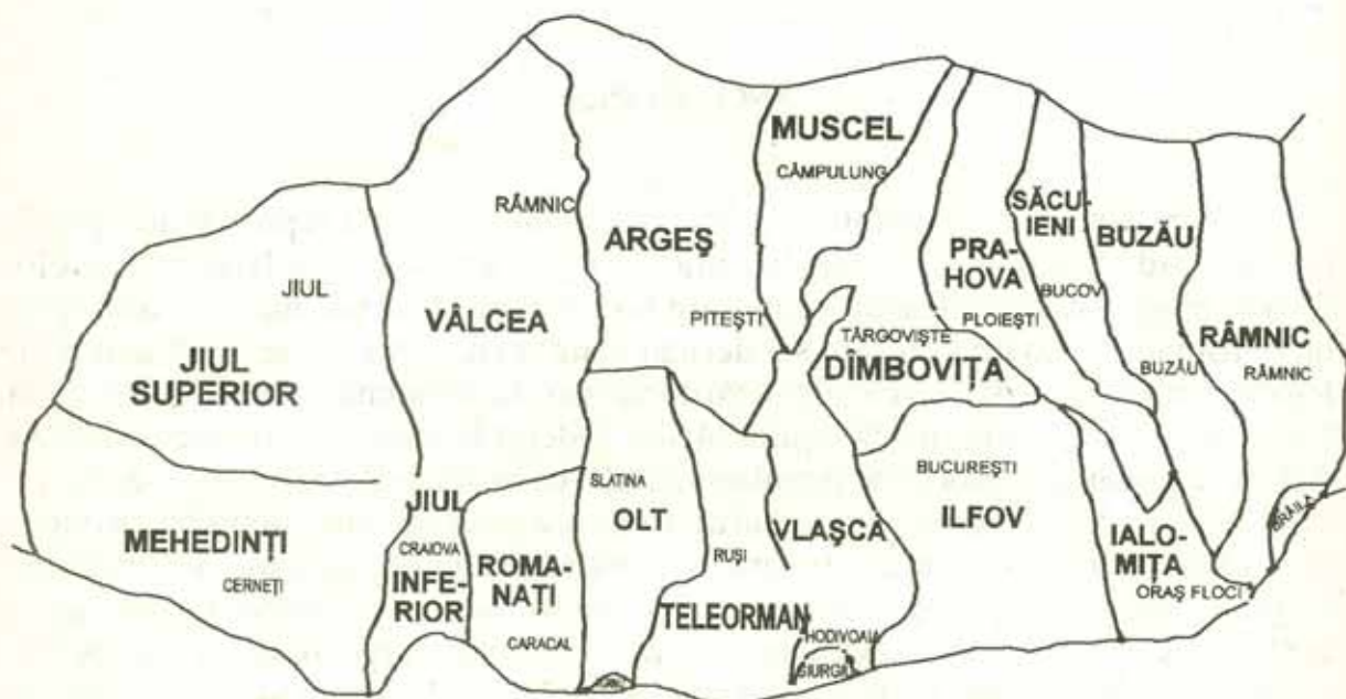
JUDEȚELE ȚĂRII ROMÂNEȘTI după harta stolnicului C. Cantacuzino (1700)

„Bărăganul era un ținut cu așezări puține, cu populație rară, foarte puțin cultivat, dar bogat în pășuni” 4 . Nu întâmplător această zonă a fost puternic afectată de pătrunderea și staționarea îndelungată a neamurilor turanice atrase de pășunile bogate existente aici.